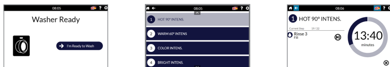
XControl FLEX PLUS-schermen voor benadering, programma's en cycli